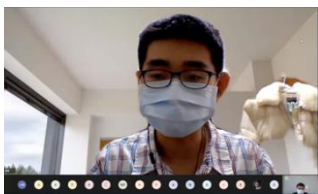
圖說：本校新生亦於本次活動中以全英文參與課程，表現得可圈可點。

介紹與報告，本校社工系新生學生於參加課程後亦努力克服語言差異以全英文報告介紹本國之相關社福團體，在國際學生面前的報告可圈可點。相信透過本次的課程擴張其視野，對其未來在本系的學習相有相當大之助益。